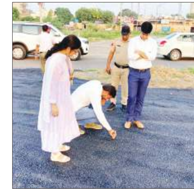
संघनन कार्य में खामी मिली, जिसे उचित तरीके से करवाने के लिए मौके पर मौजूद कार्यकारी अभियंता व कनिष्ठ अभियंता को

बता दें कि नगर निगम की ओर से सभी 20 वाडों में पैच वर्क, गलियों की रिपेयर, गड्ढे भरने, नालियां रिपेयर, सीवरेंज व मेनहोल के ढक्कन, नाला स्लैब, इंटरलॉकिंग पेवर ब्लॉक गलियों की रिलेयिंग, पानी निकासी व पाकों की रिपेयर करने जैसे जन सुविधाओं की मरम्मत के कार्य करवाए जा रहे हैं। इन कार्यों पर अनुमानित 3 करोड़ 25 लाख रुपये की राशि खर्च की जाएगी।