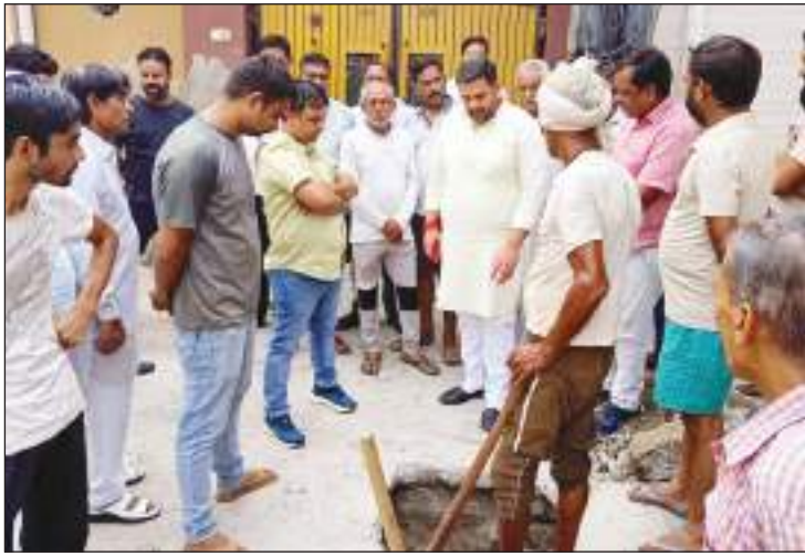
समस्या के निवारण के लिए निगम अधिकारियों को निर्देश दिए। निगम अधिकारियों ने मौके पर ही पेयजल लाइन की जांच के लिए खुदाई शुरू